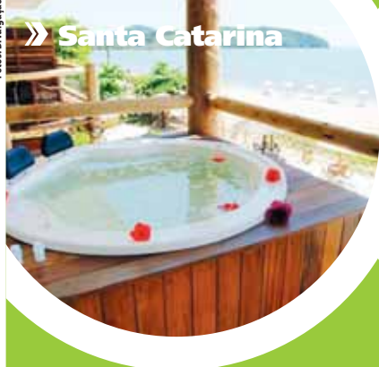
» Santa Catarina

Publicidade: 4735.8020 | e-mail: negocios@moginews.com.br | www.moginews.com.br