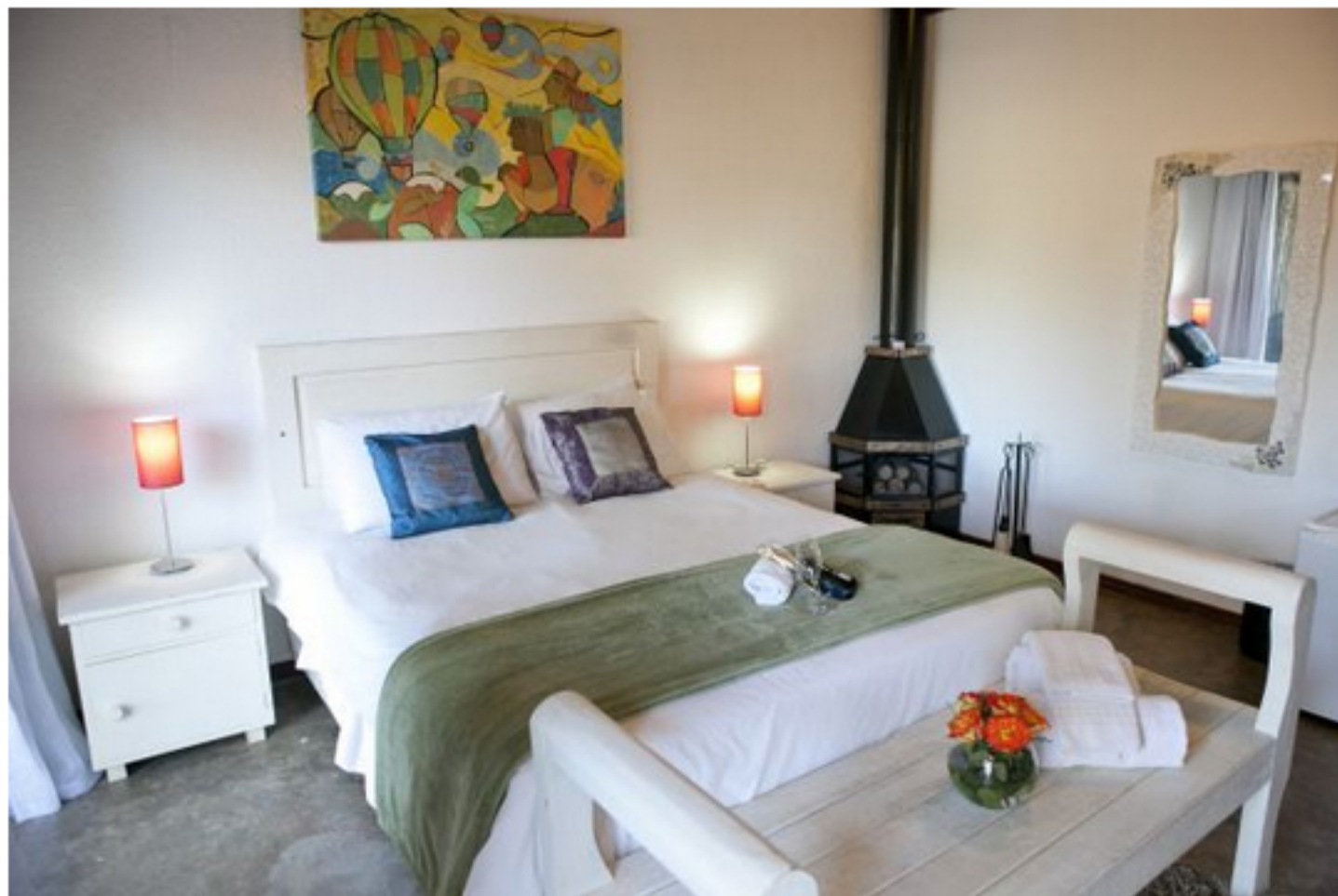
Uma das suítes do Ilha de Toque Toque Boutique Hotel

O Ilha de Toque Toque Boutique Hotel, localizado em São Sebastião, no litoral norte paulista, é o mais novo parceiro da Quintessentially, multinacional inglesa especializada em consumo de luxo. Este é o 13º empreendimento nacional a se tornar parceiro da empresa, que já firmou acordo nos mesmos moldes com o Fasano (SP), o Copacabana Palace (RJ) e o Ponta dos Ganchos (SC).